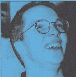
Großmeister Nigel Short

MADRID (dpa). Der britische Großmeister Nigel Short hat in El Escorial vor den Toren Madrids Schach-Geschichte geschrieben. Mit einem Remis zum 7,5:5,5-Gesamtsieg im Finale des Kandidatenturniers zur Schach-Weltmeisterschaft über den Niederländer Jan Timman erwarb sich der 27jährige das Recht, im Herbst Weltmeister Garri Kasparow herauszufordern. Short ist damit nach dem amerikanischen Schach-Genie Bobby Fischer (1972) erst der zweite Spieler aus dem Westen, dem das Kunststück gelang, in die Phalanx der russischen Schach-Koryphäen einzudringen. Im Halbfinale von Linares hatte er Ex-Weltmeister Anatoli Karpow ausgeschaltet.