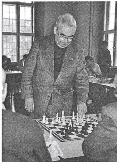
Mark Taimanov 1994

Interessant war die Teilnahme eines Schachcomputers. "Mephisto Lyon" stand unübersehbar auf einem Podest – ein echter Hingucker. Ein Mann mit ausdruckslosem Gesicht bediente das, mit einem deutlich hörbaren Lüftergeräusch agierende Gerät, von dem zu dieser Zeit noch eine besondere Faszination ausging. Am Ende dann Platz 13 und 2350 Elo-Punkte für die Maschine.